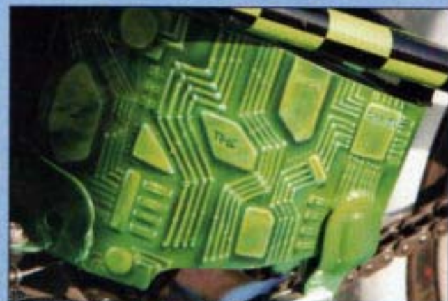
■ W&W olietank met wiet-DNA