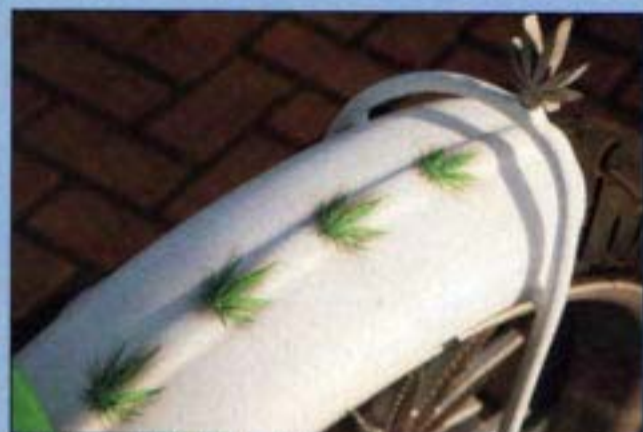
■ Subtiel wietblad als mini sissybar

een land is waar je niet meer de gevangenis in wordt gegoooid als je afwijkende ideeën hebt.