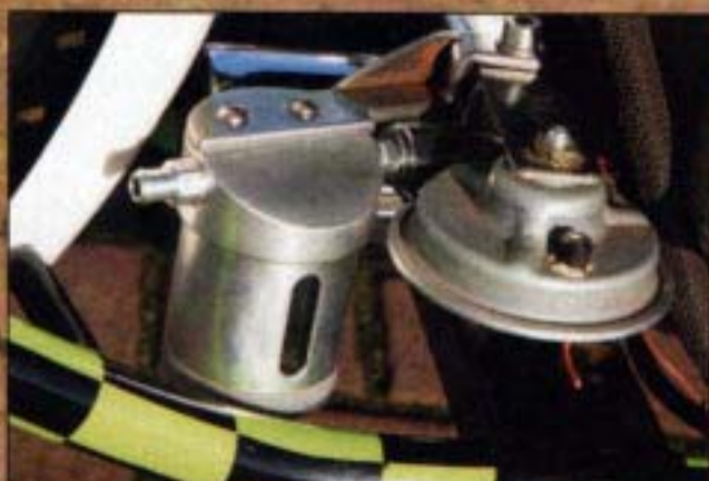
■ Olieontfluchting van aluminium