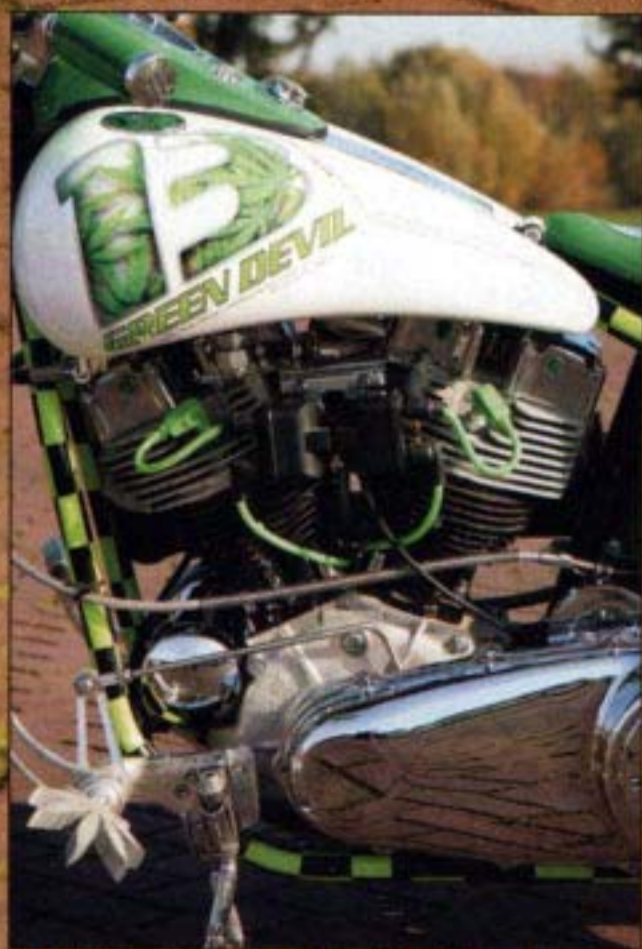
■ Mallory ontsteking zorgt voor de krachtige vonken

Bouwtechnieken en de onderdelenmarkt lopen nog ver achter. Het eerste bedrijf dat zich ging toelagen op custombikes is nog maar zeven jaar geleden begonnen. Het zal dan ook jaren duren voor hetzelfde niveau bereikt is als in de rest van (West-) Europa. De mogelijkheden zijn er beperkt, de bedrijven hebben een veel bescheidener budget dan in het westen en, niet onbelangrijk, de technische infrastructuur en machinerieën zijn gedateerd. Uit de verhalen en anekdotes van Voytec kun je je maar net voorstellen met welke beperkte middelen daar wordt gewerkt. Des te opmerkelijker en knapper is het dan ook om te zien wat er gepresteerd wordt. De weg is er vaak langer, de tegenslagen kunnen groot zijn, het is moeilijk aan materia-