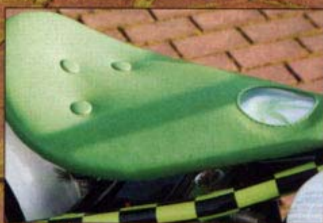
■ Zadel van FRM met mooi verwerkt wiet logo